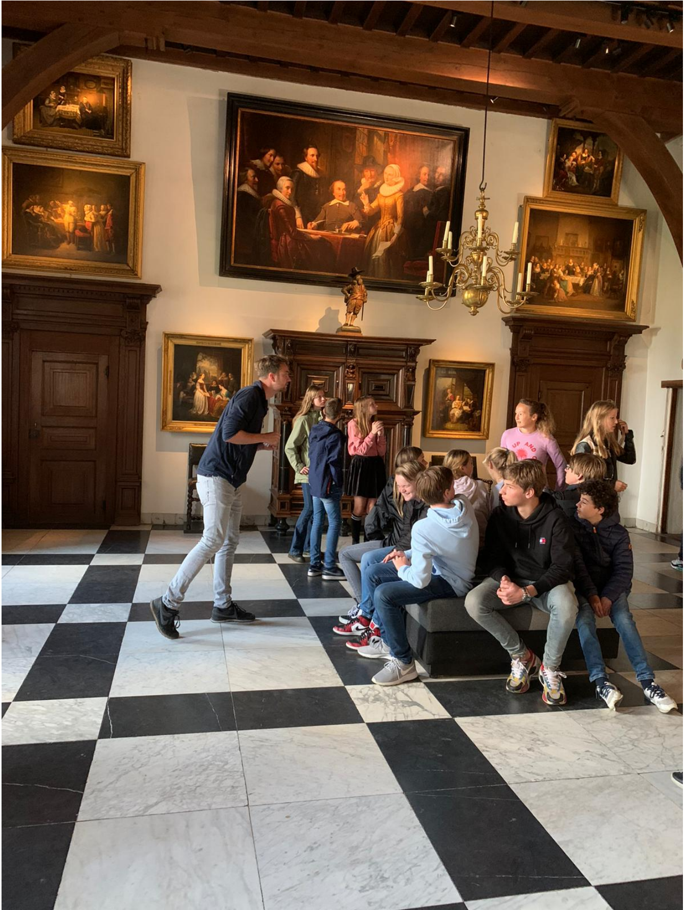
De Ridderzaal, vol verhalen op doek